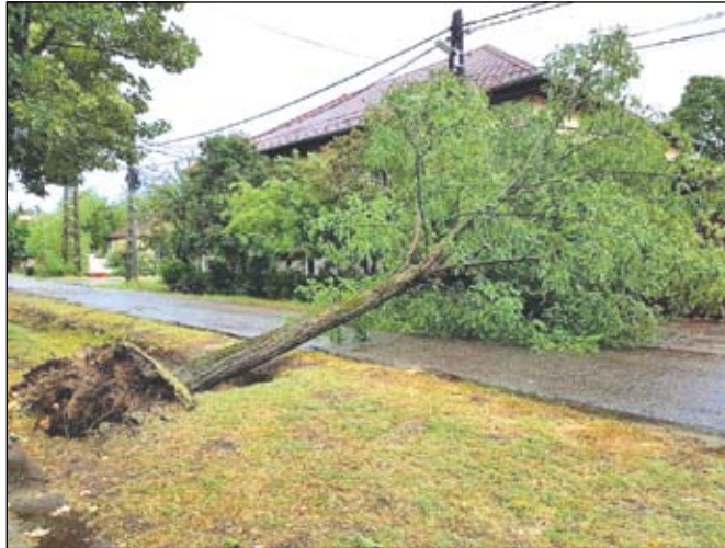
Umgestürzte Bäume überall

Viele Einwohner und Betroffene beteuerten, dass sie einen solchen Ausbruch von Naturgewalten noch nie erlebt hätten. Jeder hofft nun, dass das Wetter sich für dieses Jahr ausgetobt hat und in der näheren und möglichst auch ferneren Zukunft bei großer Hitze nur öfter mal stillen Regenschick... V.M.