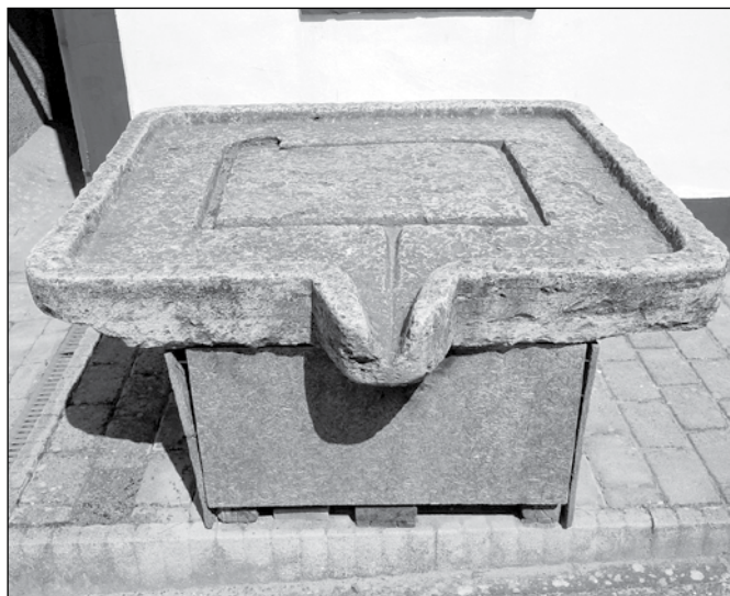
Untersatz einer alten Weinpresse

Wenn man heute nach Nadwar kommt und die vielen Keller erblickt, denkt man automatisch an den Wein. Ja, es ist einerseits unsere Pflicht, andererseits machen das viele gerne, sich mit dem Wein zu beschäftigen. Es ist bekannt: Wir haben in Nadwar mehr Weinkeller als Häuser im